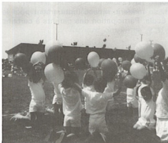
Le lendit des petits est fini. Prêts pour le lâcher des ballons.

Se présenter avec le livret de famille et le carnet de santé.