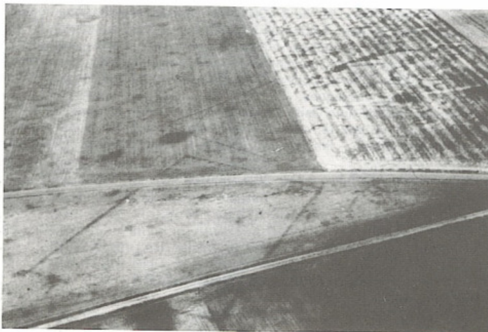
Enclos et fossés apparaissent grâce à la sécheresse de 1976. La voie romaine se trouve en bas sur la photographie.

Une projection montrant ces enclos et les traces de la voie romaine Évreux-Dreux sur le territoire du Mesnil et de l'Estrée pourra être envisagée, mettant fin à toutes les hypothèses erronées.